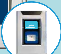
DK CL-A0509B со сканером штрих-кодов